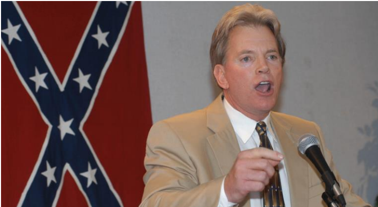
تصویر ۲۶: دیوید دوک، سیاستمدار و فعال راست‌گرای آمریکایی

کوکلاسلان‌ها به فعالان به ظاهر مخالف نژادپرستی رسیده‌اند، اما کماکان رگه‌های بسیار پررنگ راسیسم افراطی در مواضع و رویکردهایشان قابل مشاهده است. شاید بتوان استدلال ساده‌شده این افراد در مخالفت با اسرائیل را در عبارت «دشمن مشترکی به نام یهود» خلاصه کرد. یکی از معروف‌ترین چهره‌های این جریان در آمریکا، دیوید دوک است. کسی که همزمان می‌تواند حامی ایران و ترامپ و ضدیهود باشد.