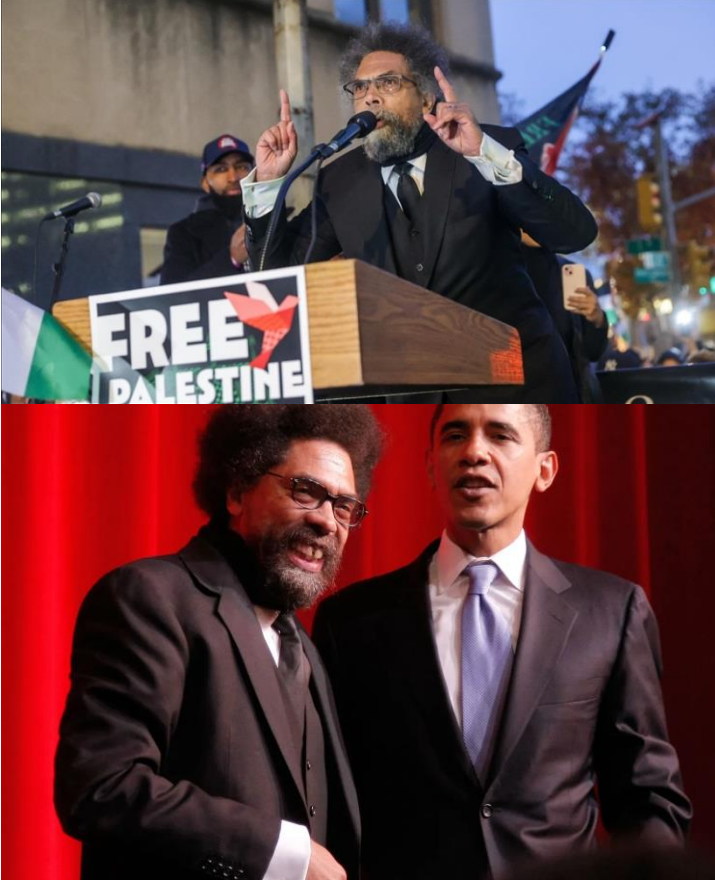
تصویر ۸: کرنل وست، آکادمیسین آمریکایی

معاصر در آمریکا محسوب می‌شود. می‌توان گفت کرنل وست با اندیشه‌های رادیکال و چپ‌گرایانه‌اش، یکی از نمادها و نظریه‌پردازان مهم جناح پروگرسو در آمریکا محسوب می‌شود.