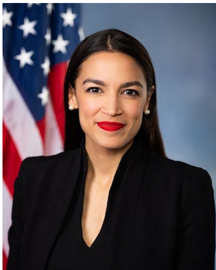
تصویر ۶: الکساندریا اوکازویو-کورتز، نماینده کنگره

اوکازویو-کورتز با دیدگاه‌های رادیکال و سبک کارزار انقلابی خود، به یکی از چهره‌های پرحاشیه و درعین‌حال محبوب در میان لیبرال‌های جوان آمریکایی تبدیل شده است.