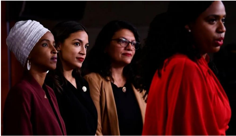
تصویر ۷: جناح قانون‌گذاران دموکرات پروگرسو