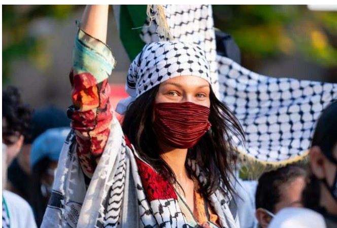
تصویر ۲۱: بلا حدید در تظاهرات حمایت از فلسطین در آمریکا

بلا حدید که سوپرمدلی شهیر است، در ۷ ماه گذشته فعالانه نسبت به جنایات غزه واکنش نشان داده و با تکیه بر دنبال‌کنندگان بسیار زیاد خود در فضای مجازی، درباره فلسطین روشنگری کرده است.