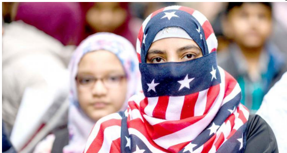
تصویر ۲۳: مسلمانان آمریکایی