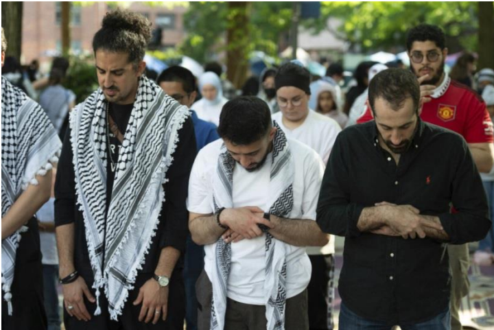
تصویر ۲۴: دانشجویان مسلمان در دانشگاه جورج واشنگتن در حاشیه اعتراضات ضداسرائیلی

بی‌شک جمعیت مسلمانان آمریکا نقشی مهم در شعله‌ور شدن آتش اعتراضات ضدجنگ و ضداسرائیلی در آمریکا دارد. با این حال کماکان روح محافظه‌کاری غلبه دارد، اما قابل انکار نیست که در نسل جوان‌تر و حتی نوجوانان مسلمان آمریکایی، هویت‌خواهی در سال‌های اخیر رشد قابل‌اعتنایی کرده و به نظر می‌رسد تحولات غزه نیز در افزایش این روند تاثیر به‌سزایی داشته است. مسلمانان آمریکایی می‌توانند تا کمتر از ۴۰ سال دیگر، جمعیتی بیش از یهودیان داشته باشند و از سویی دیگر رشد توان‌مندی اقتصادی و حتی جدی‌تر شدن لابی‌های منطقه‌ای، منجر به نقش‌آفرینی فعال‌تری نسبت به گذشته شده و همین مساله توجه سیاست‌گذاران آمریکایی را به خود جلب کرده است.