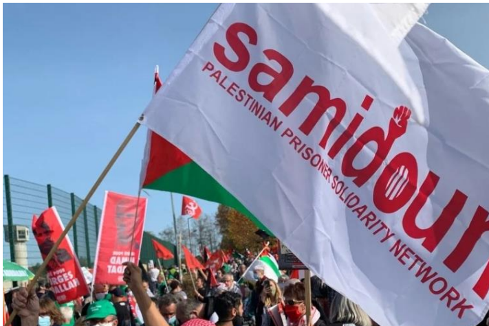
تصویر ۲۵: صامدون، شبکه فعالان حامی فلسطین در جهان

اساسا هدف اصلی در پیرنگ کردن نقش چپ‌های محور مقاومتی، کشاندن پای دخالت‌های ایران به خیزش دانشجویی در آمریکا و تبدیل آن به مساله‌ای امنیتی است. با این حال نمی‌تواند نقش این گروه‌ها را از اساس منکر شد؛ هرچند وزن میدانی اندکی دارند. گروه‌های ضدامپریالیست دانشجویی با وجود عده اندک، اما قدرت بسیج‌شوندگی بالایی دارند. روسیه در سال‌های اخیر استفاده زیادی از این گروه‌ها در بستر اروپا و آمریکا کرده است، اما علی‌رغم ظرفیت‌های قابل اعتنای ایران در این بافتار، سیاست منسجمی برای سازماندهی این گروه‌ها وجود نداشته است.