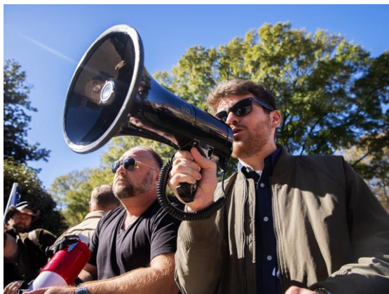
تصویر ۲۷: نیک فوئنتس، راست‌گرای نژادپرست مسیحی

اما احتمالاً یکی از مهمترین تغییر رویه‌ها در پسا طوفان الاقصی در اردوگاه راست مذهبی آمریکا، مورد کندیس اوونز است. کندیس که بیشتر یک چهره رسانه‌ای به شمار می‌رود، سیاهپوست حامی ترامپ، مخالف جنبش BLM، منتقد واکسن و مروج دیدگاه‌های افراطی مسیحی است که پس از طوفان الاقصی، از مجموعه رسانه‌ای راست مسیحی مورد حمایت لابی صهیونیستی خارج شد و در اظهارنظری آشکار بعد از حمله اسرائیل به بیمارستان المعمدانی، وابسته به یک کلیسای مسیحی در غزه، به انتقاد از اسرائیل و یهودیان پرداخت.