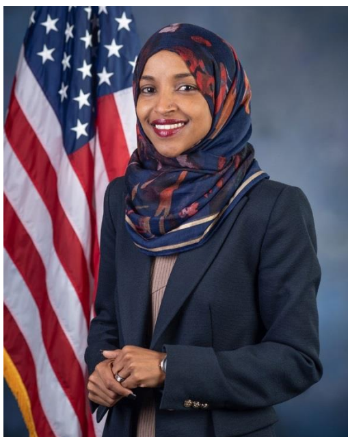
تصویر ۳: ایلهان عمر

که گفتارهای ضداسرائیلی دارد، اما مشخصاً با برخی جنبش‌های ضدصهیونیستی مثل BDS اعلام مخالفت کرده است. در نهایت به دلیل مواضع اخیر، ایلهان عمر در رأی‌گیری پنجشنبه ۲ فوریه ۲۰۲۳، با رأی اکثریت جمهوری‌خواه مجلس نمایندگان از کمیته روابط خارجی این مجلس اخراج شد. مجلس نمایندگان آمریکا با ۲۱۸ رأی موافق جمهوری‌خواهان و ۲۱۱ رأی مخالف دموکرات‌ها، عمر را از کمیته روابط خارجی این مجلس اخراج کرد. کاخ سفید در واکنش به این اقدام، اخراج عمر را «نمایشی سیاسی» خوانده است. از سویی دیگر جمهوری‌خواهانی که اخراج او را خواستار شدند، می‌گویند ایلهان عمر به خاطر مواضع «صلاحت عضویت در کمیته روابط خارجی را ندارد. دموکرات‌ها می‌گویند این تصمیم جمهوری‌خواهان، «انتقام‌جویی سیاسی» است.