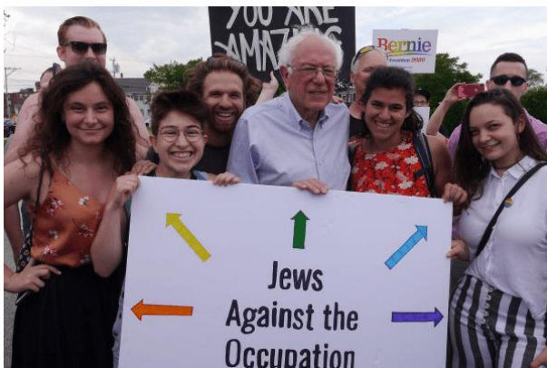
تصویر ۱۵: برنی سندرز در جمع هواداران خود

با وجود آنکه وی در اعتراضات اخیر شرکت نکرده است، ولی با سخنرانی چندباره در حمایت از متحصنین در روزهای اولیه اعتراضات، جایگاه خود را به‌عنوان رهبر سیاسی و چهره جریان معترض، تثبیت کرد.