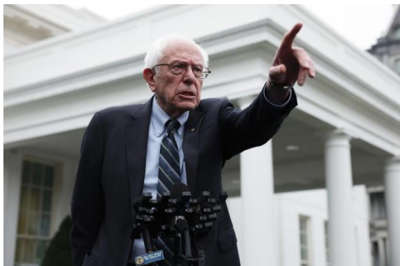
تصویر ۱۴: برنی سندرز، رهبر جریان پروگرسیو

مبارزه چپ معاصر آمریکا بدل شد و توانست محبوبیت زیادی در میان لیبرال‌های جوان و کارگران به دست آورد.