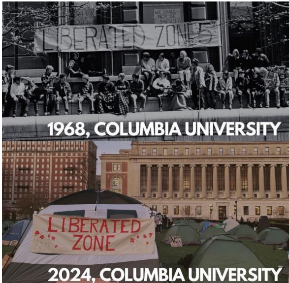
تصویر ۱: اعتراضات دانشگاه کلمبیا از ۱۹۶۸ تا ۲۰۲۴

همدستی دانشگاه کلمبیا در نسل‌کشی غزه هستیم. نکته جالب‌توجه در این بیانیه، قرار دادن تصویر تجمع دانشجویان دانشگاه کلمبیا در سال ۱۹۶۸ در اعتراض به جنگ ویتنام در کنار تصاویر خیمه‌های برپا شده در محوطه دانشگاه در صبحگاه ۱۷ آوریل ۲۰۲۴ بود.