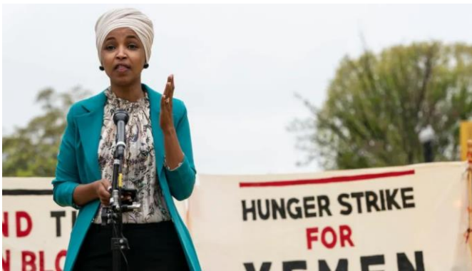
تصویر ۲: ایلهان عمر، نماینده کنگره

وی نماینده کنگره آمریکا از شهر مینه‌سوتا است. او یک سیاست‌مدار زاده سومالی و دارای تابعیت ایالات‌متحده آمریکا است. ایلهان عمر در سومالی در خانواده‌ای مسلمان زاده شده و در سال ۱۹۹۰ در جریان جنگ‌های داخلی سومالی از این کشور مهاجرت کرد و پیش از مهاجرت به آمریکا مدت چهار سال در یک اردوگاه پناهندگان در کنیا زندگی می‌کرد. ایلهان در سال ۲۰۱۶ عضو مجلس نمایندگان مینه‌سوتا شد و اولین آمریکایی-سومالیایی بود که به عضویت این مجلس درمی‌آمد. در ششم نوامبر ۲۰۱۸ او در انتخابات مجلس نمایندگان آمریکا، برنده شد و از حوزه انتخابیه پنجم مینه‌سوتا به مجلس راه یافت و اولین آمریکایی-سومالیایی شد که به این مجلس راه می‌یابد. عمر اولین زن باحجاب، اولین زن پناهجو و به همراه رشیده طالب نخستین نماینده زن مسلمان مجلس نمایندگان ایالات‌متحده آمریکا است. عمر در عین حال