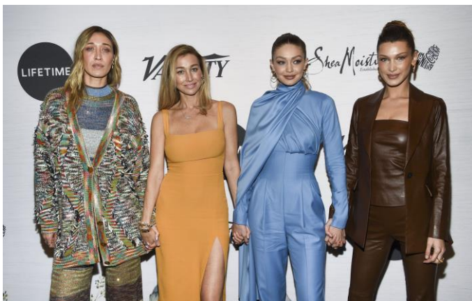
تصویر ۲۰: خواهران فلسطینی آمریکایی حدید: بلا، جی جی، ماریل و آنا

بلا حدید که سوپرمدلی شهیر است، در ۷ ماه گذشته فعالانه نسبت به جنایات غزه واکنش نشان داده و با تکیه بر دنبال‌کنندگان بسیار زیاد خود در فضای مجازی، درباره فلسطین روشنگری کرده است.