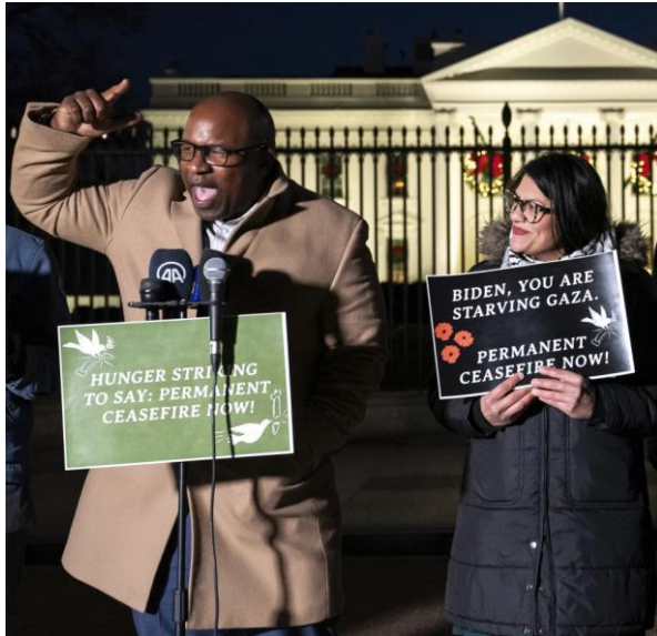
تصویر ۵: جمال باومن در کنار رشیده طالب، نمایندگان کنگره

نگهبان بوده است. باومن یکی از پیشگامان ترویج دستور کار پیشرو و عدالت اجتماعی در حزب دموکرات به شمار می‌آید. باومن یکی از اعضای برجسته جناح پروگرسو یا چپ میانه در حزب دموکرات محسوب می‌شود.