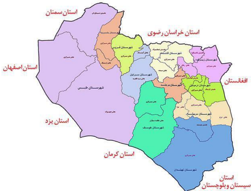
نقشه شماره ۲: نقشه خراسان جنوبی بر اساس آخرین تقسیمات کشوری

تأسیس شد (همان: ۲۹). تاریخ شکل‌گیری شهرستان بیرجند به سال ۱۳۱۶ برمی‌گردد که نشان از پیشینه ۸۰ ساله این شهرستان دارد. تاریخ شکل‌گیری شهرستان‌های دیگر استان خراسان جنوبی از جمله قاینات، فردوس، نهبندان، درمیان، سربیشه، سرایان، بشرویه به ترتیب به سال‌های ۱۳۵۸، ۱۳۲۳، ۱۳۶۸، ۱۳۸۴، ۱۳۸۲، ۱۳۸۴ و ۱۳۸۷، برمی‌گردد (شاطری، ۱۳۹۱: ۲۰). بر اساس آخرین تقسیمات کشوری، استان خراسان جنوبی در سال ۱۳۹۵، دارای ۱۱ شهرستان، ۲۵ بخش، ۲۸ شهر و ۶۱ دهستان بوده است که بعداً شهرستان طبس نیز به آن اضافه شد. (سالنامه آماری استان خراسان جنوبی، ۱۳۹۶: ۵۹).